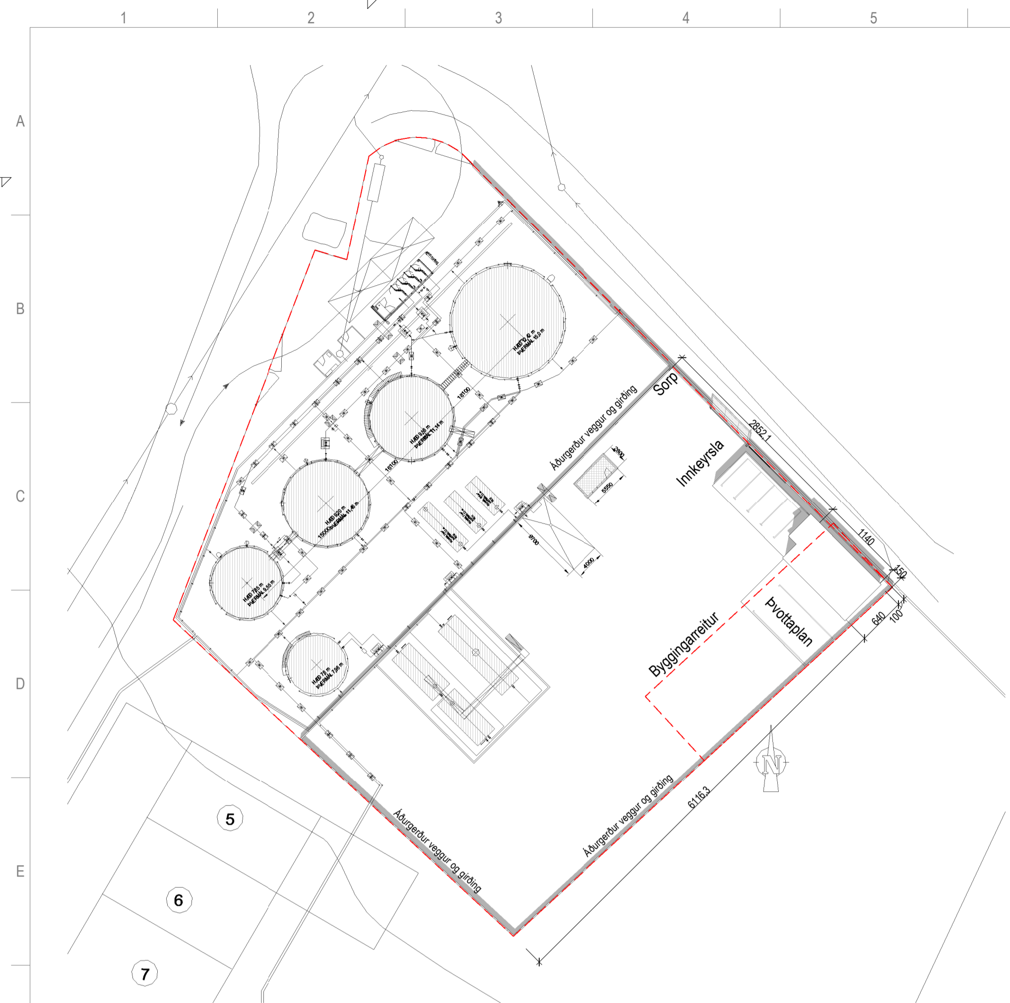
Afstöðumynd 1 : 500