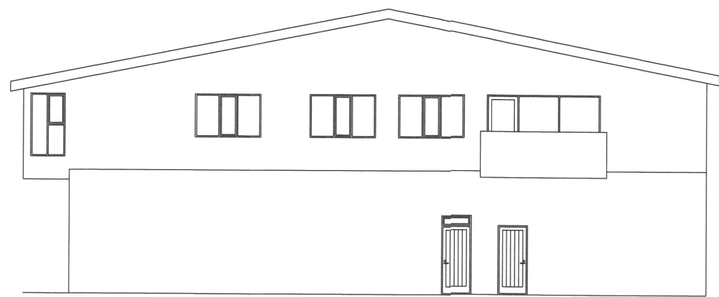
útlit austur mkv 1:100