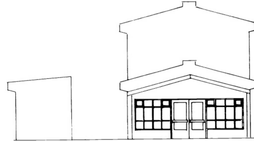
VESTURHLIÐ M = 1:100