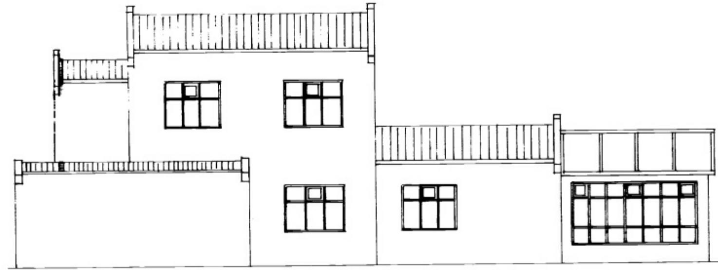
NOÐRÐURHLIÐ M = 1:100