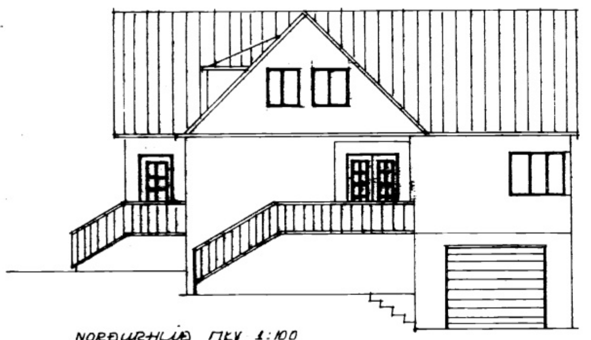
NORÐURHLIÐ MKV 1:100