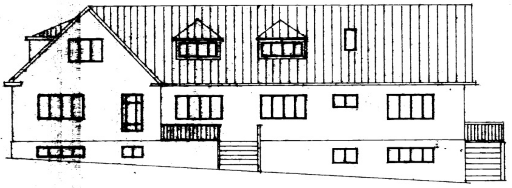
AUSTURHLIÐ MKV 1:100