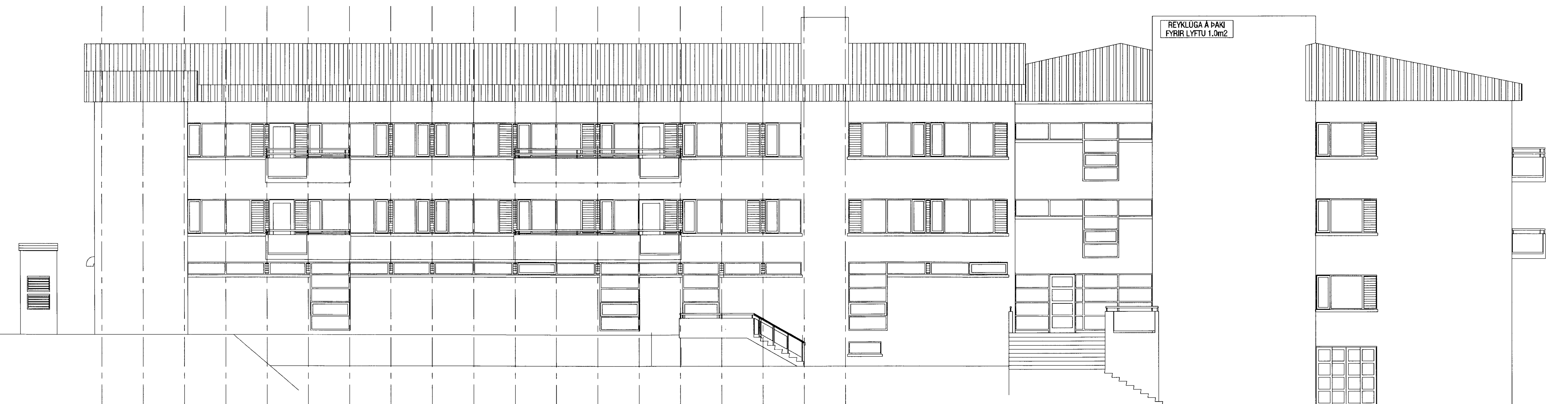
Ásýnd Norður mkv. 1:100