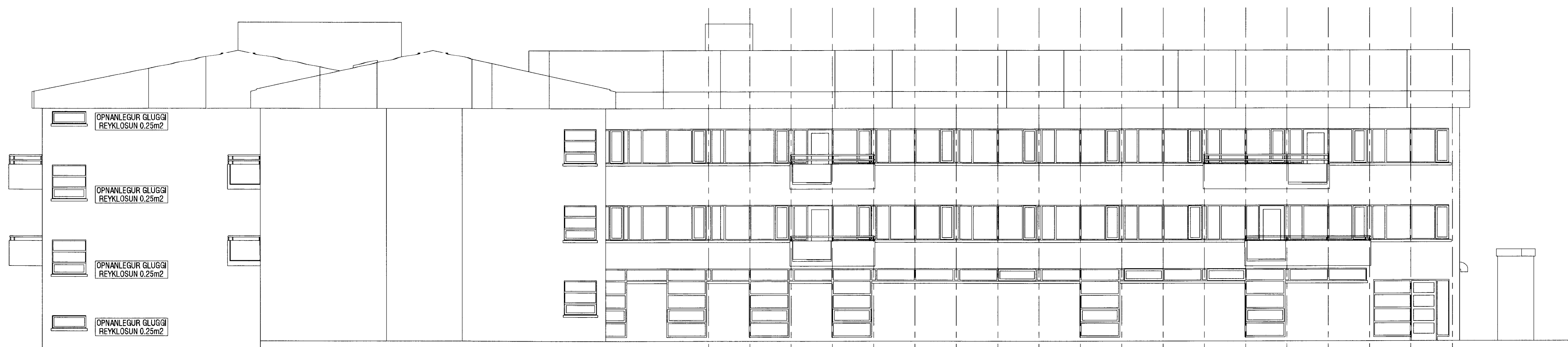
Ásýnd Suður mkv. 1:100