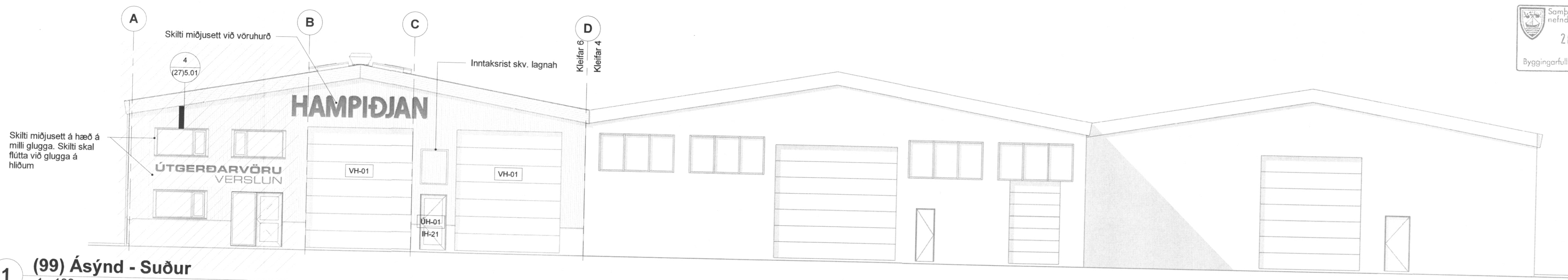
1 (99) Ásýnd - Suður 1 : 100