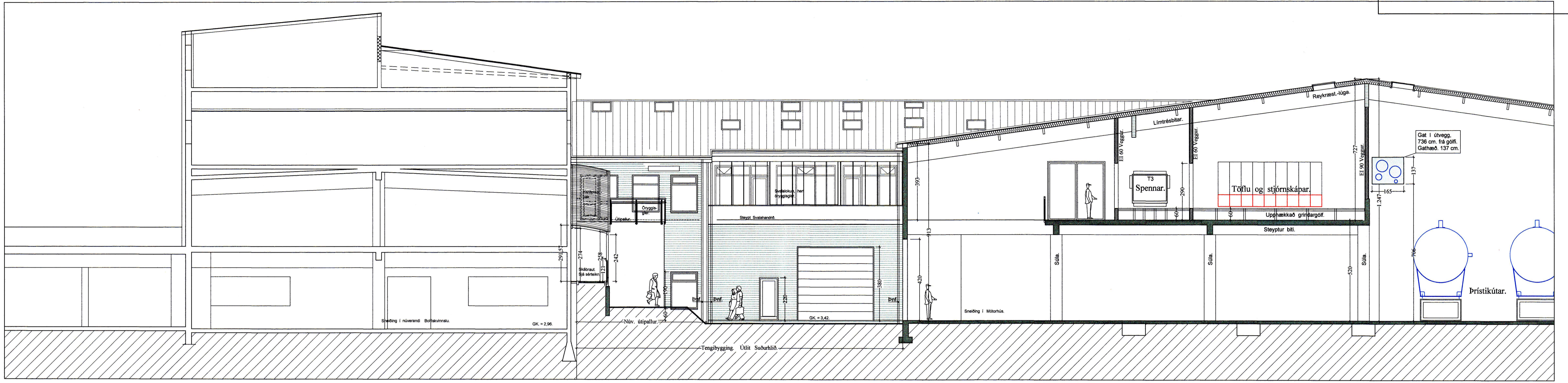
Útlit -- Suðurhlíð. 1:100