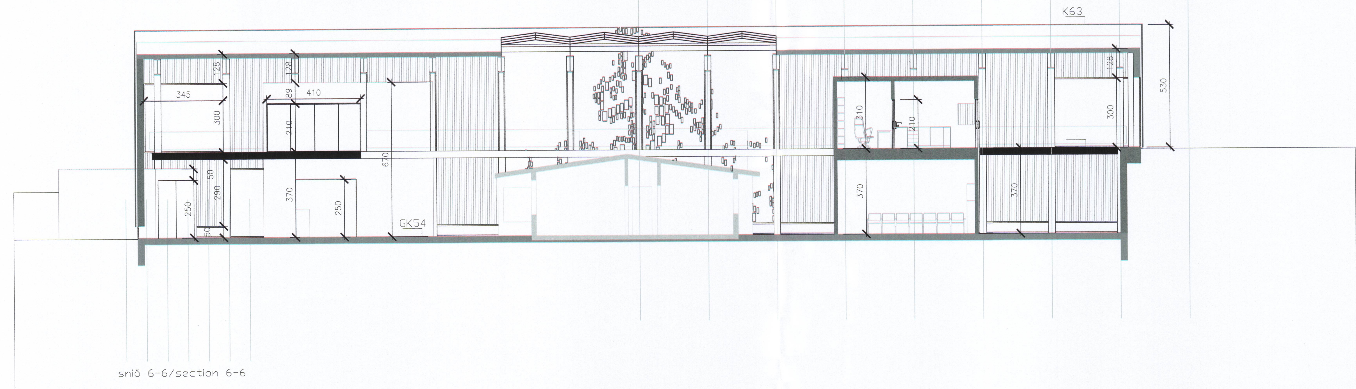
snið 6-6/section 6-6