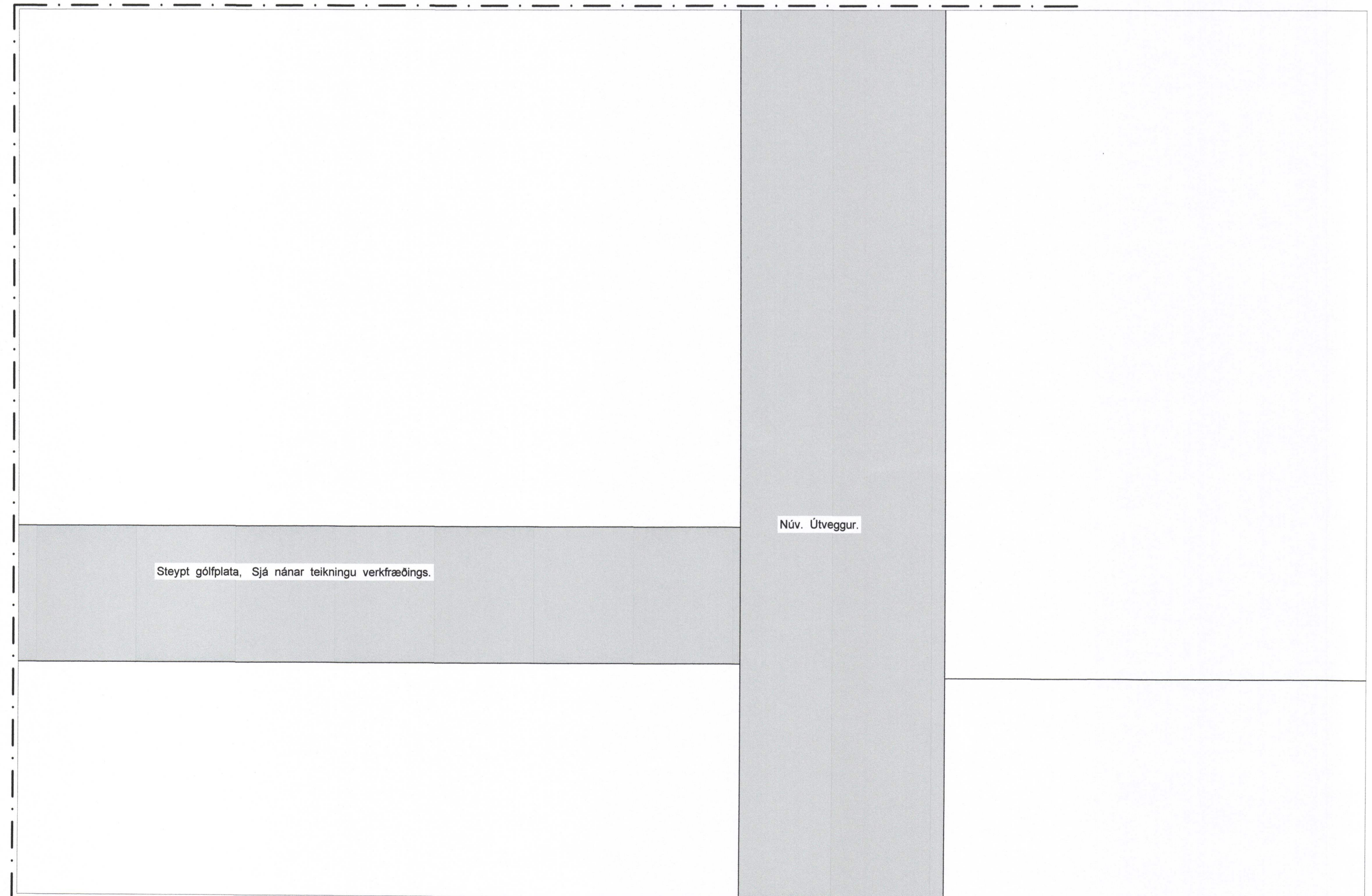
Frágangur á gólfi í Uppsjávarvinnslu, þar sem blástursfrystar munu standa. 1:5

Uppsjávarv.2002.dwg 23.2.2016 15:53 JonG