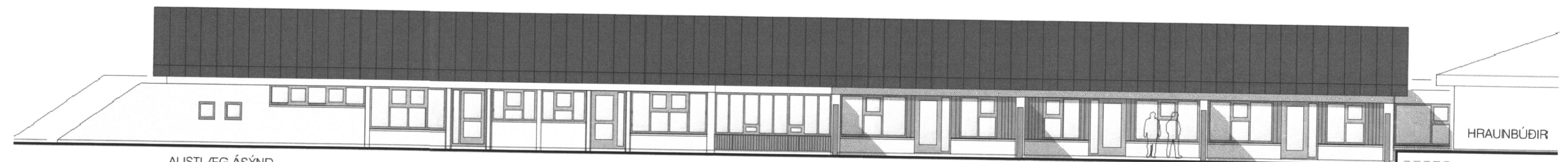
AUSTLÆG ÁSYND M. 1:100