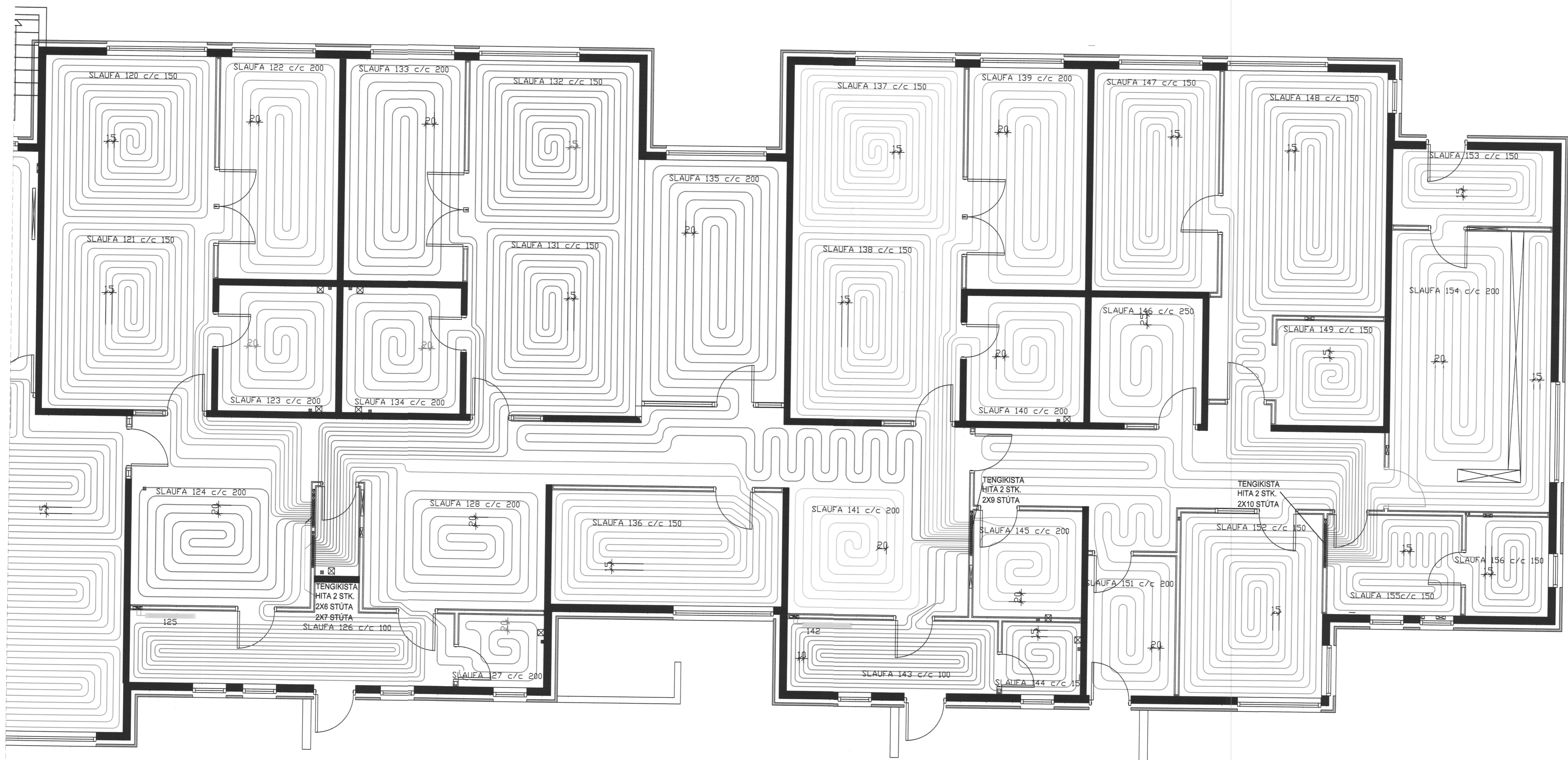
GRUNNMYND 1. HÆÐ HITALAGNA Í PLÖTU M=1:50