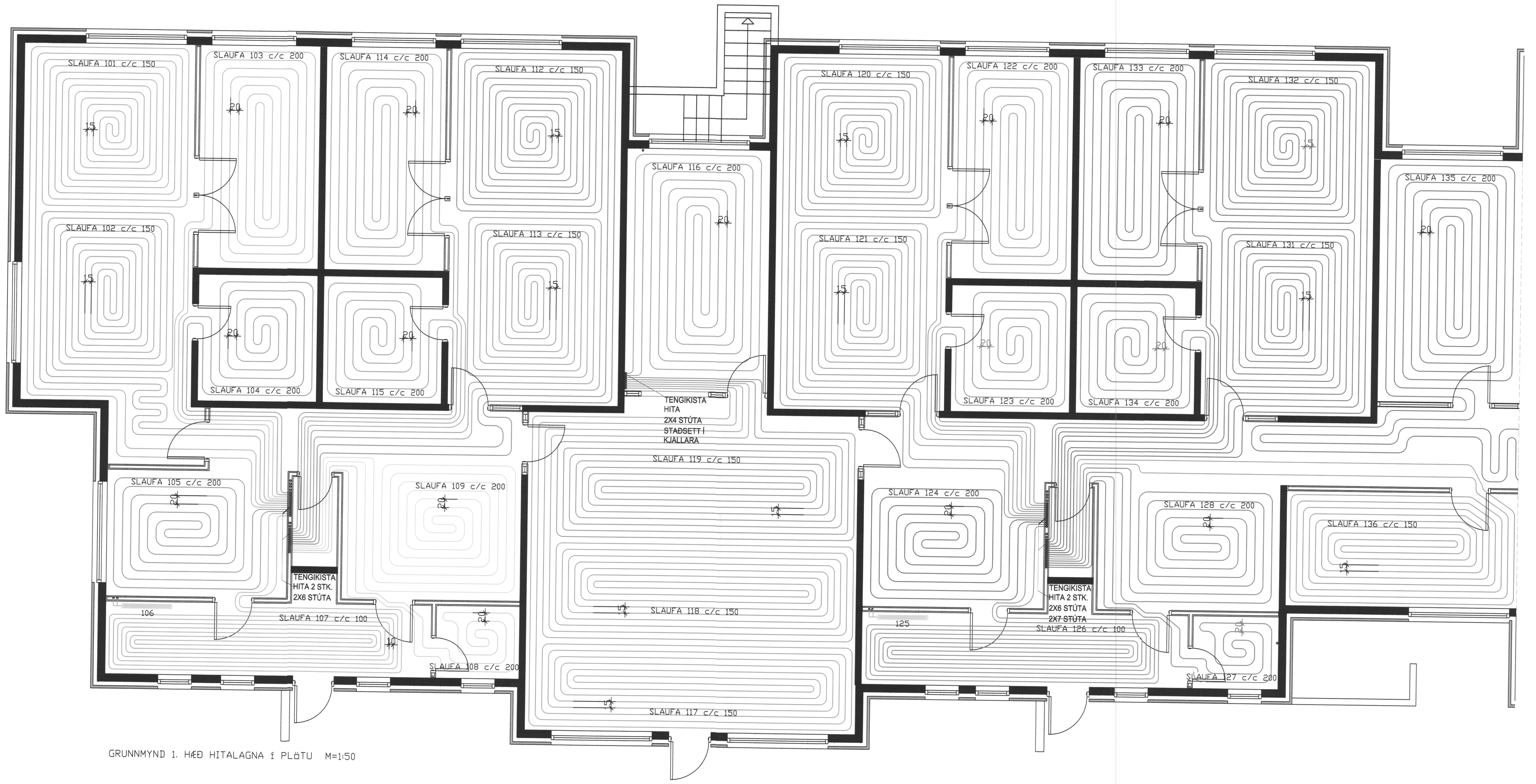
GRUNNMYND 1. HÆÐ HITALAGNA Í PLÁTU M=1:50

SAMÞYKKT AF BYGGINGARFULLTRÚA 28.10.2005 Sigurður Ástfríðsson BYGGINGARFULLTRÚA / INVESTIÞINGÆTILL